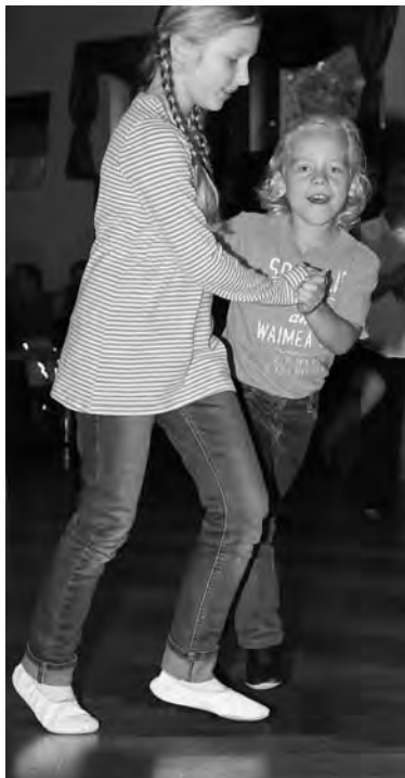
Wir zeigen's den Großen!

Der nördlichste Tanzclub Hamburgs feierte sein 40-jähriges Bestehen mit einem Tag der offenen Tür. Am 29. Oktober konnten sich die Besucher bei Kaffee und Kuchen über das Angebot des Vereins informieren. Es wurden viele Fragen gestellt und auch Anregungen und Wünsche für neue Tanzangebote geäußert. Einiges davon wird kurzfristig umgesetzt werden.