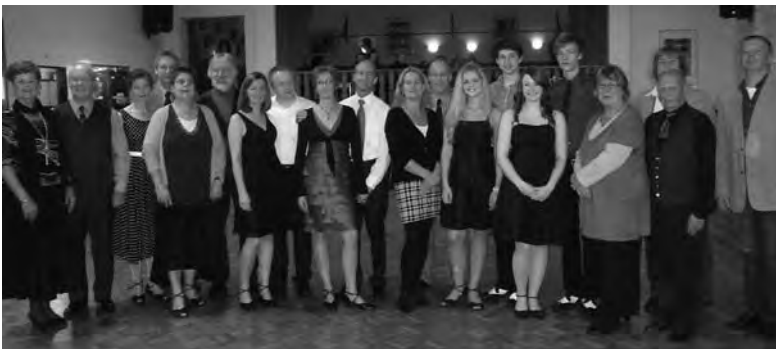
Zum 35. Mal DTSA-Abnahme in Jever