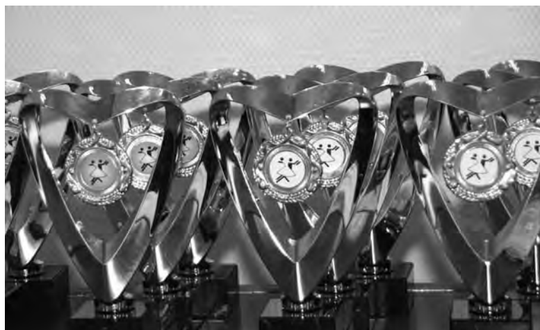
Pokale, Pokale, Pokale