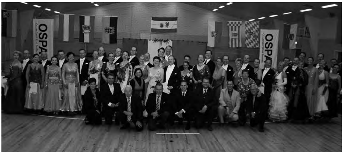
„Gruppenbild mit Dame“: Alle Turnierpaare und Wertungsrichter des zweiten Turniertages

Berichte über die Deutschen Meisterschaften und die Weltmeisterschaft stehen im überregionalen Teil dieser Ausgabe.