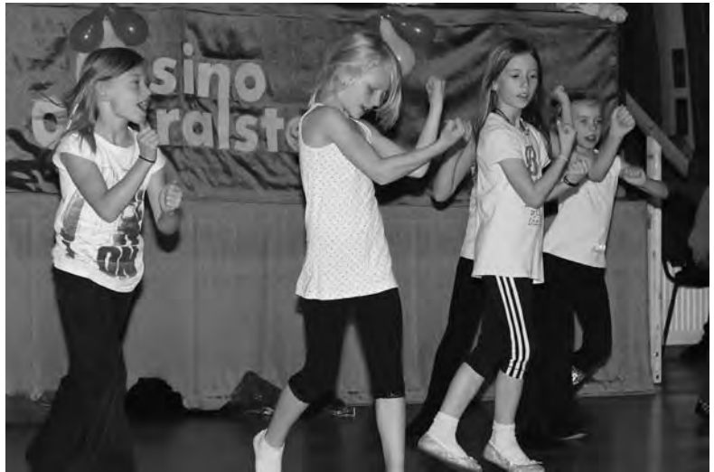
Kinder haben Spaß

Der nördlichste Tanzclub Hamburgs feierte sein 40-jähriges Bestehen mit einem Tag der offenen Tür. Am 29. Oktober konnten sich die Besucher bei Kaffee und Kuchen über das Angebot des Vereins informieren. Es wurden viele Fragen gestellt und auch Anregungen und Wünsche für neue Tanzangebote geäußert. Einiges davon wird kurzfristig umgesetzt werden.