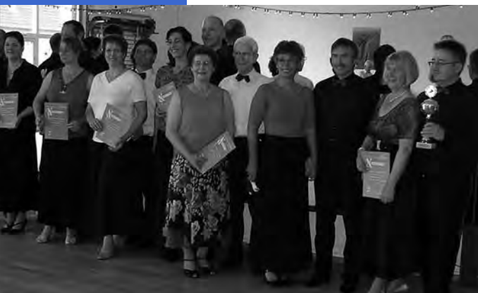
Blau-Weiße Rübe Paare

In den vergangenen Monaten wurde beim TSC Blau-Weiß Neustadt viel gewerkelt, gehämmert, gestrichen und geschwitzt. Es gab auch mal Muskelkater oder einen verletzten Finger. Die Mitglieder des Vereins bauten einen leerstehenden Getränkemarkt in Neustadt am Rübenberge in eine Tanzsportstätte um.