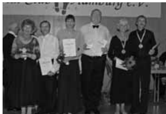
Zwei Länder, drei Paare: Die komplette Besetzung der Senioren III D auf der Landesmeisterschaft.