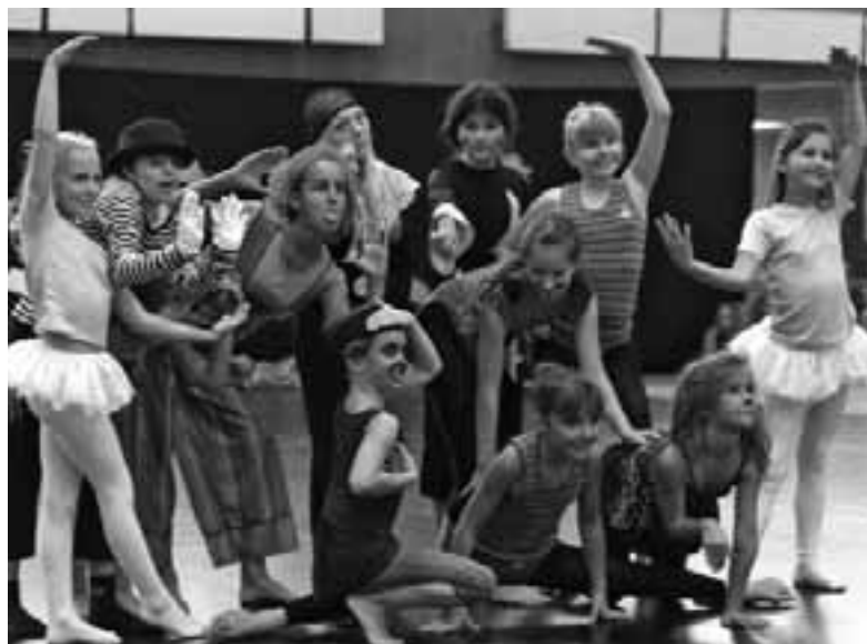
Die Sugarcubes wurden zweite in der jüngsten Altersgruppe.

be begeisterte nicht nur die mitgereisten Fans, sondern auch die fünf Wertungsrichter. Der dritte Platz ging an „Candygirls“ aus Wendezelle. Die „Little Dancer“ vom TC Schöningen wurden vierte. Die „Grashüpfer“ aus Grasleben und die „Moskitos“ aus Schöningen belegten die folgenden Plätze. In der mittleren Altersgruppe ging der Sieg an die Formation „Vidi Vici“ vom VfL Westercelle. „La candela“, VfL Lehre, wurde vierter, gefolgt von „Les Bleues“, TK Helmstedt und „Stardust“ (TC Schöningen). Stardust legte anders als im letzten Jahr diesmal eine temporeiche Choreografie hin und hat sich für das kommende Jahr entschieden, in der Jugendverbandsliga zu starten. In der Altersgruppe III stellte der TC Schöningen keine eigene Mannschaft, denn die meisten Jugendgruppen dieser Altersklasse starten bereits seit einigen Jahren erfolgreich in der Jugendverbandsliga. Es siegten die Jugendlichen von „Choreomanies“ aus Langwedel.