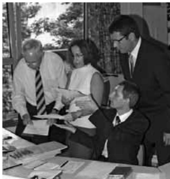
Beratung in der Turnierleitung: Wer kommt weiter?