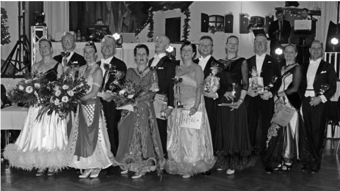
Siegerehrung Senioren III S.