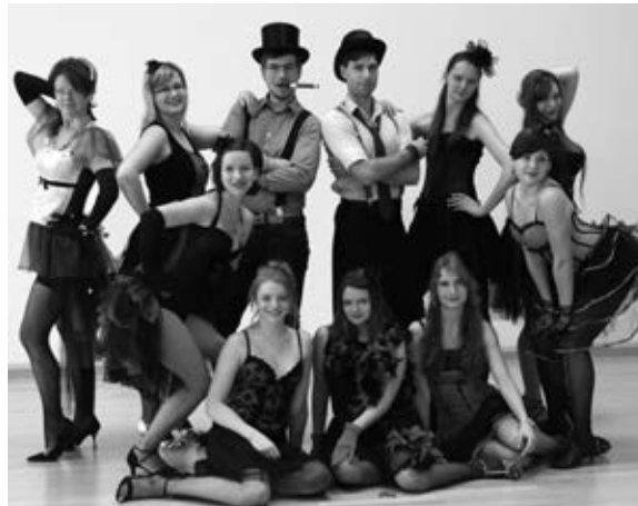
Die Dancing Diamonds.