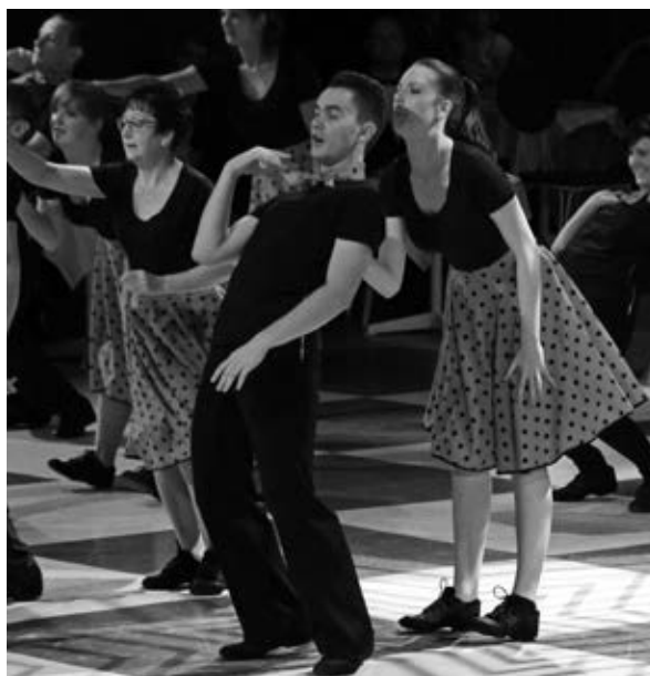
„American Dreams“: Foto: Maria Reichel